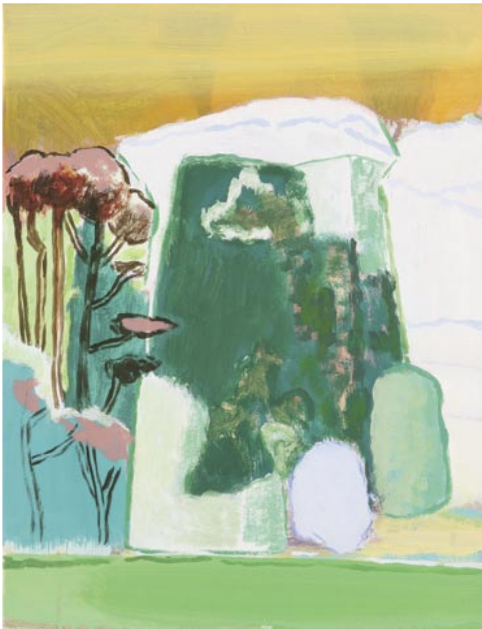
Neal Tait , My Lantern , 2006

Tempera, acrylverf, linnen / Tempera und Acrylfarbe auf Leinwand, 51 x 46 cm