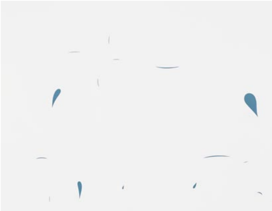
Sebastian Schaffmeister , Romantic- (3.2.2005) Acrylverf, linnen / Acrylfarbe auf Leinwand, 100 x 130 cm