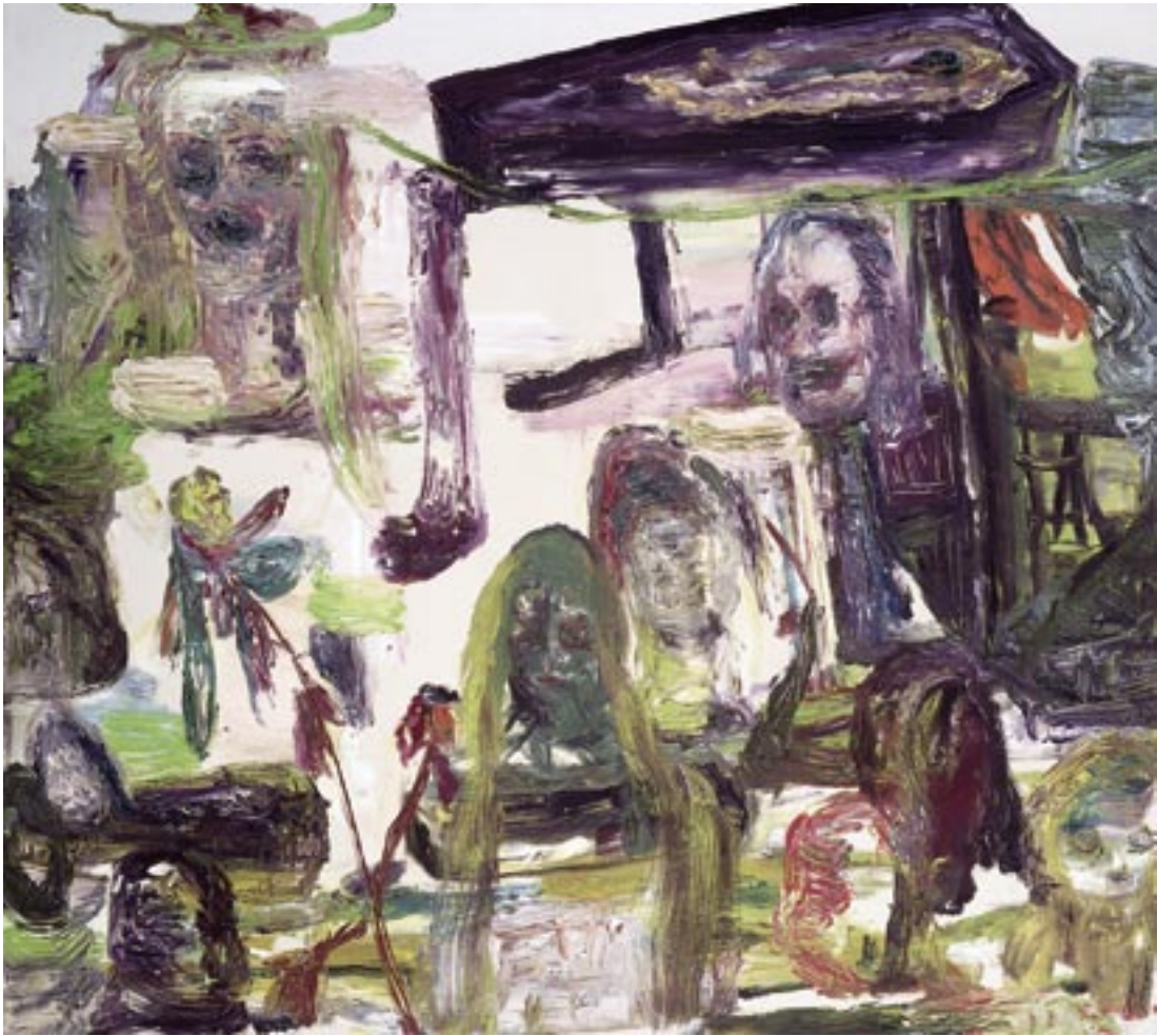
Peter Otto , The day we called Agent Orange , 2000 Olieverf, katoen / Ölfarbe auf Nessel, 160 x 180 cm