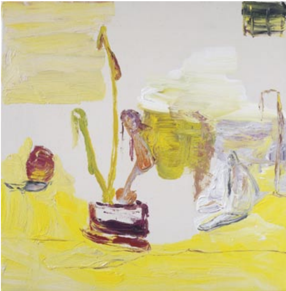
Peter Otto , Stilleven , 2003

Olieverf, katoen / Ölfarbe auf Nessel, 80 x 80 cm