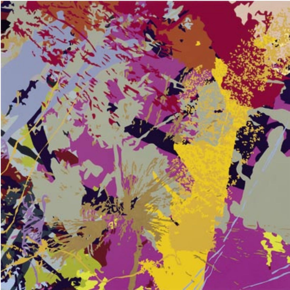
Ingrid Calame , Mow. how? how? How! , 2006

Lakverf, aluminium / Lackfarbe auf Aluminium, 61 x 61 cm