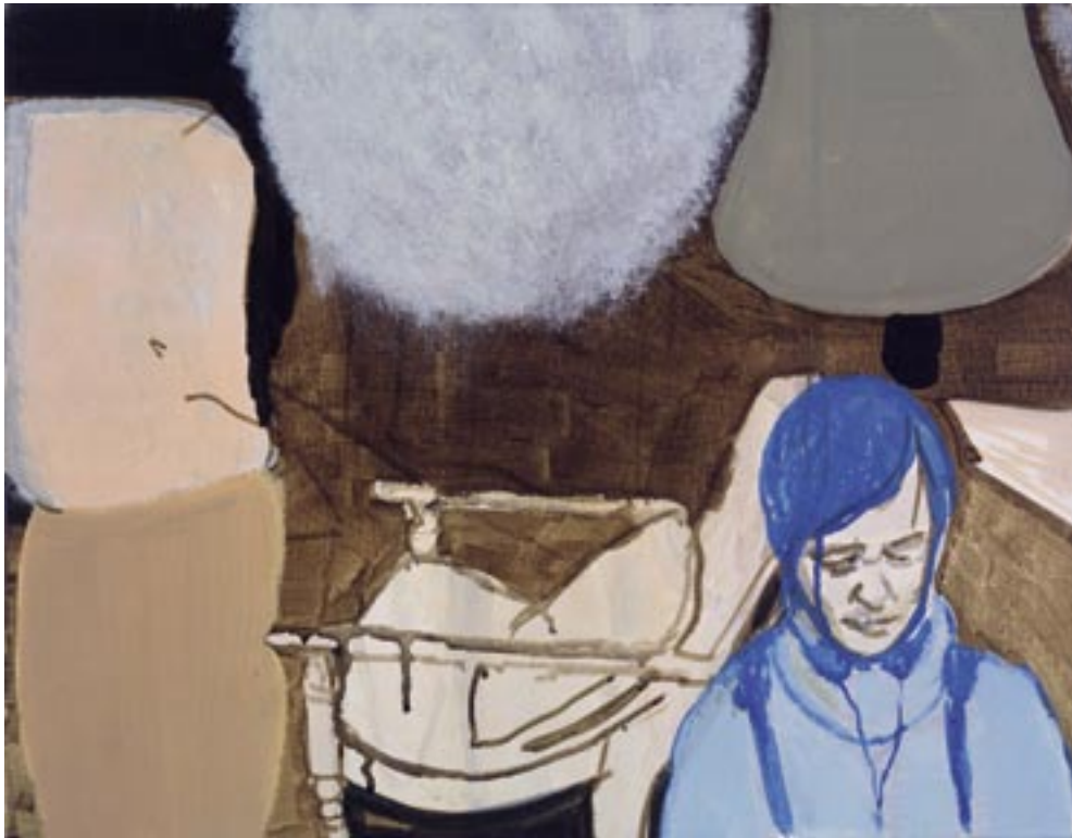
Neal Tait , Boy and Room , 2003

Acrylverf, linnen / Acrylfarbe auf Leinwand, 35,7 x 46 cm