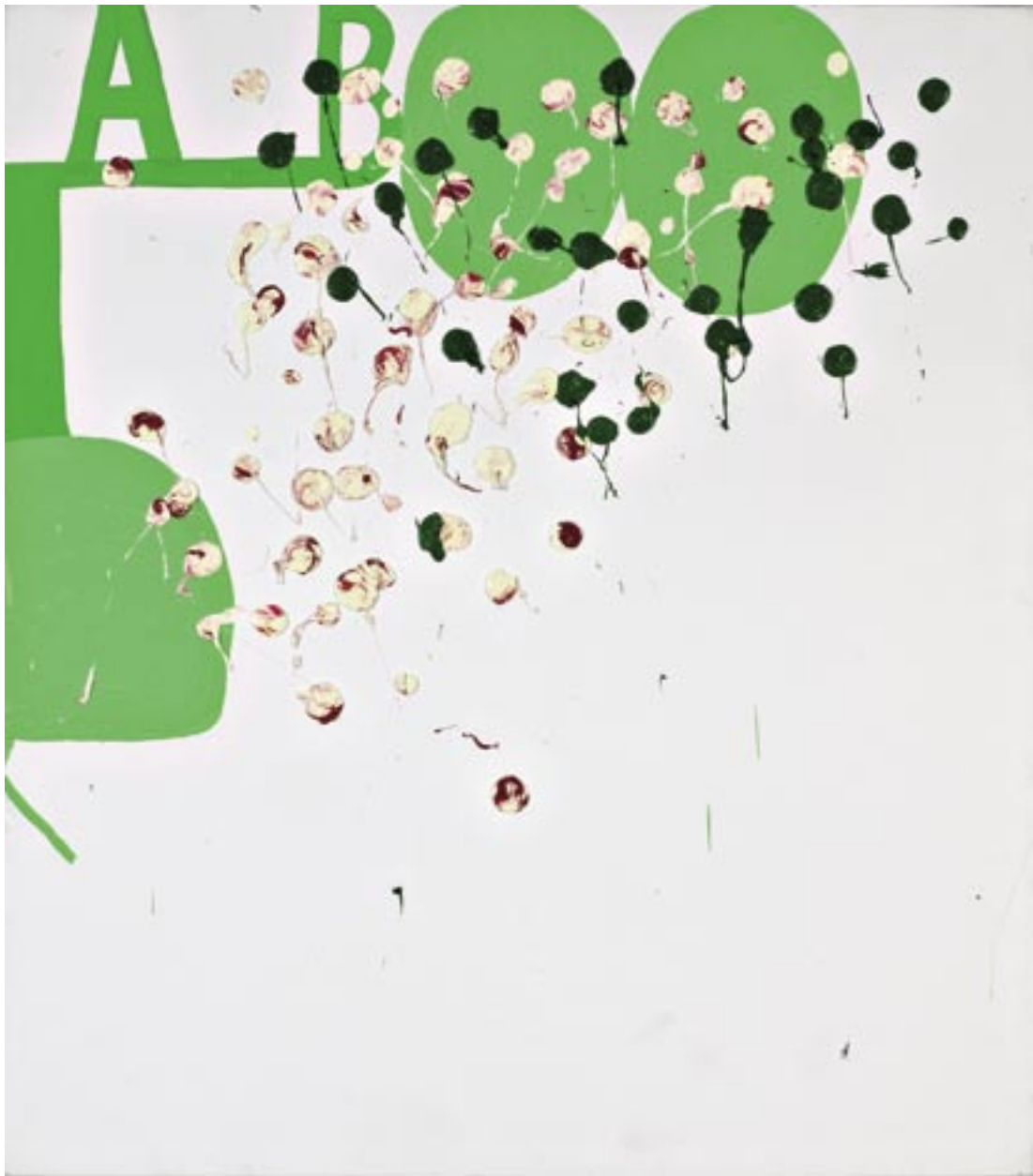
Olav Christopher Jenssen , Lackmus Painting No. 4 , 2003/2004

Olieverf, acrylverf, linnen / Ölfarbe und Acrylfarbe auf Leinwand, 165 x 145 cm