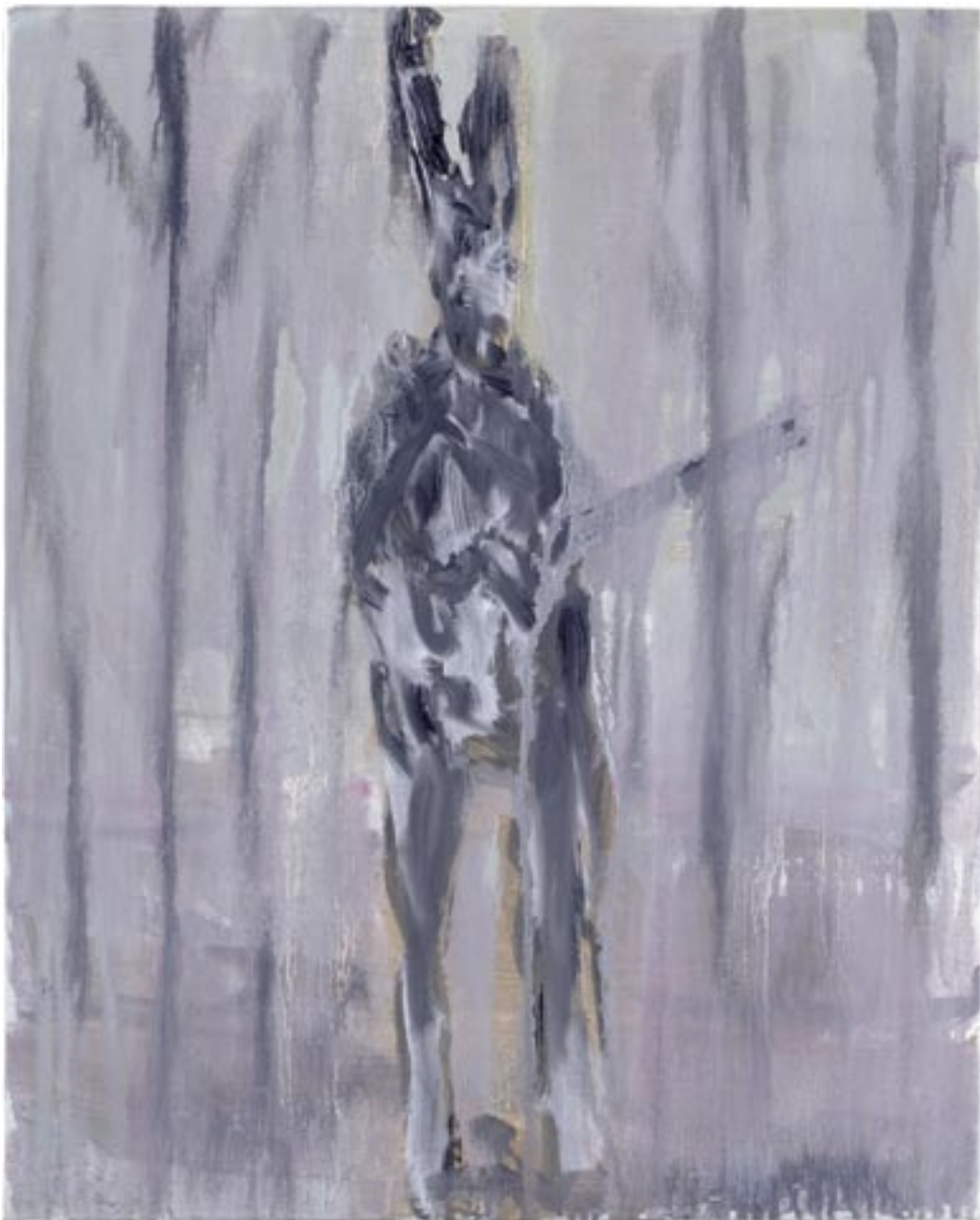
Valérie Favre , Lapine univers – Guitare II , 2006 Olieverf, linnen / Ölfarbe auf Leinwand, 50 x 40 cm