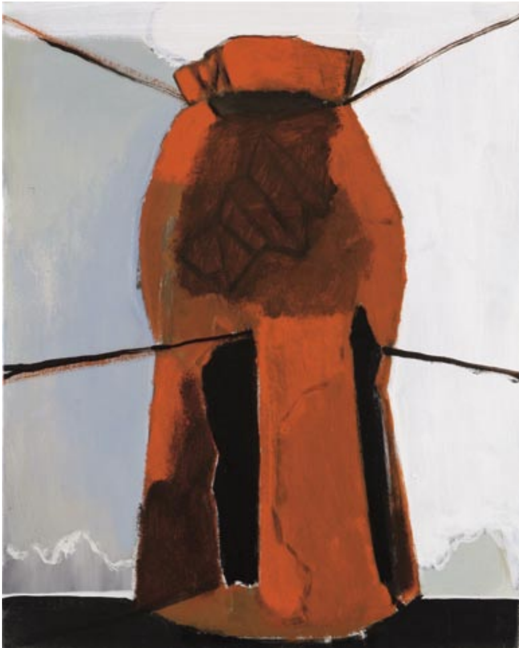
Neal Tait , Tower , 2006

Tempera, acrylverf, linnen / Tempera und Acrylfarbe auf Leinwand, 51 x 41 cm