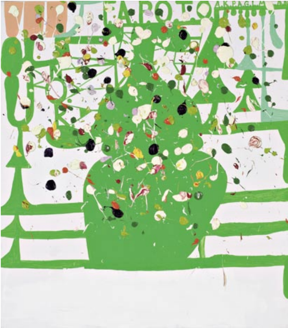
Olav Christopher Jenssen , Lackmus Painting No. 3 , 2003/2004

Olieverf, acrylverf, linnen / Ölfarbe und Acrylfarbe auf Leinwand, 165 x 145 cm