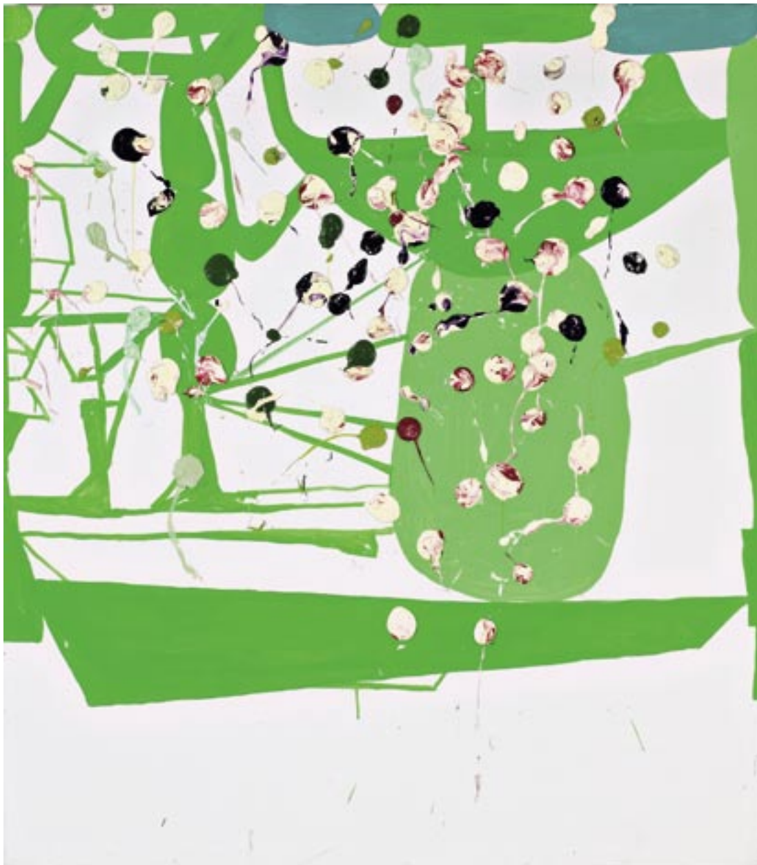
Olav Christopher Jenssen , Lackmus Painting No. 9 , 2004

Olieverf, acrylverf, linnen / Ölfarbe und Acrylfarbe auf Leinwand, 165 x 145 cm