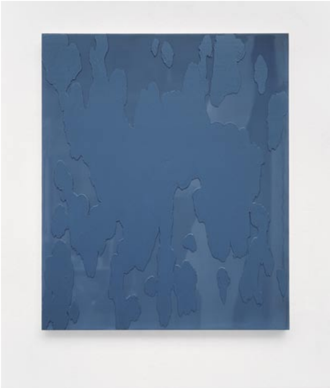
Raymund Kaiser , BL-H1-06 , 2006

Alkydverf, olieverf, hout / Alkydfarbe und Ölfarbe auf Holz, 60 x 50 cm