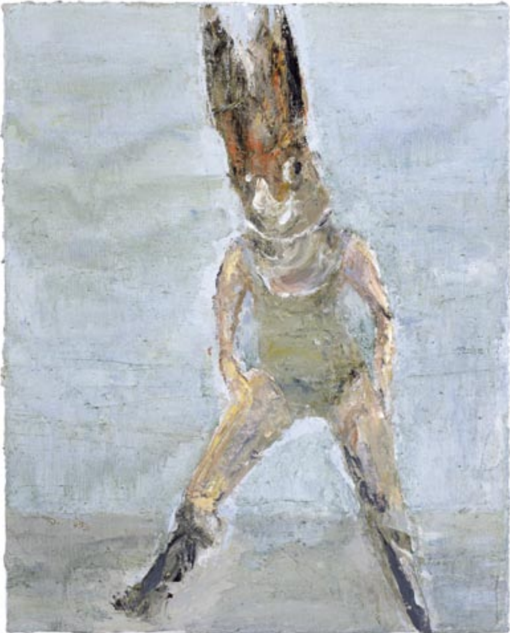
Valérie Favre , Lapine univers – Rote Maske , 2006 Olieverf, linnen / Ölfarbe auf Leinwand, 50 x 40 cm Courtesy Galerie Wohnmaschine, Berlin, en / und Galerie Nathalie Obadia, Paris